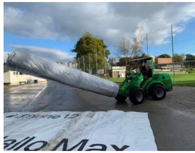
„Einhorn“ für Transport der Bahnen.