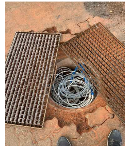
Elektro-Schacht für die Stromverteilung zu den Lichtmasten, zur Platzbewässerung und der Geräte-Garage.