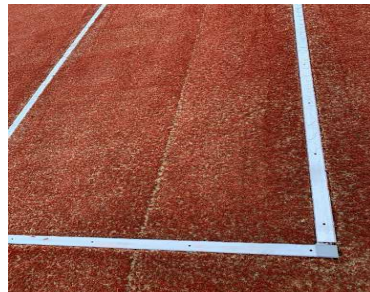
Linien aus Aluprofilen werden verlegt. Plastiklinien werden darauf eingeklickt. Diese können je nach Abnutzung des Kunstrasens tiefer gestellt werden.