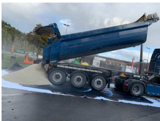
Quarzsand wird angeliefert.