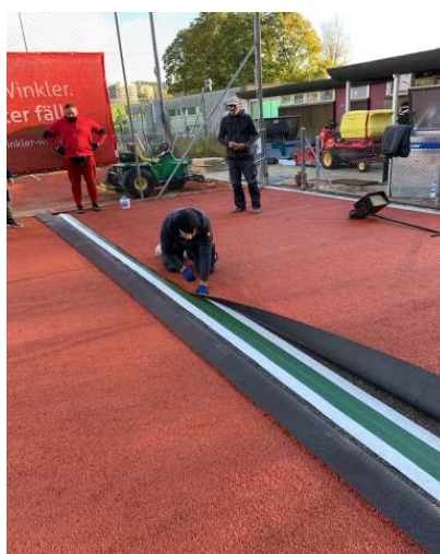
Bahnen werden verklebt.