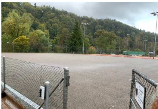
Unterlage / 2 Schichten Kies / 1 Schicht Sand eingewalzt.